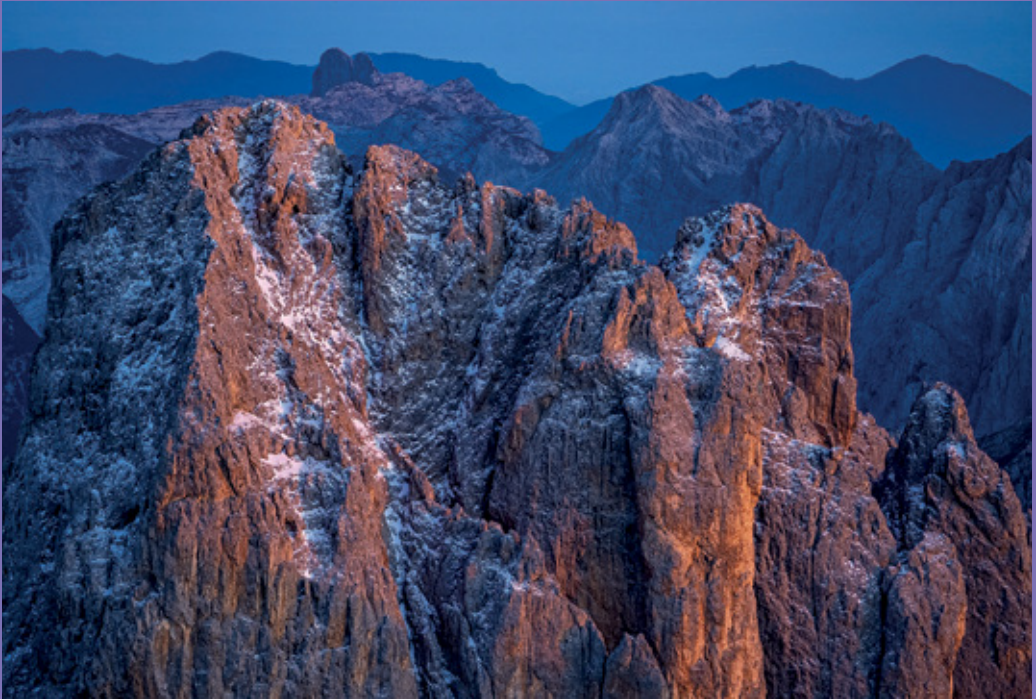
Alessandro Beltrame Cima Canali al tramonto