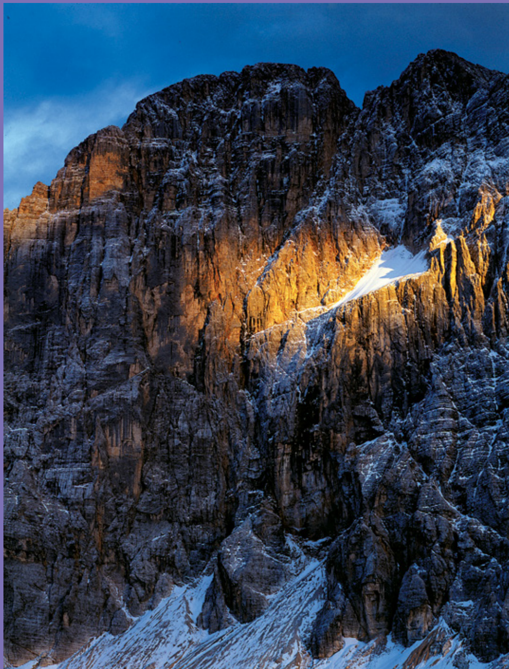
Manrico Dell'Agnola Parete Nord-Ovest della Civetta, scattata nel 2005 dal rifugio Tissi