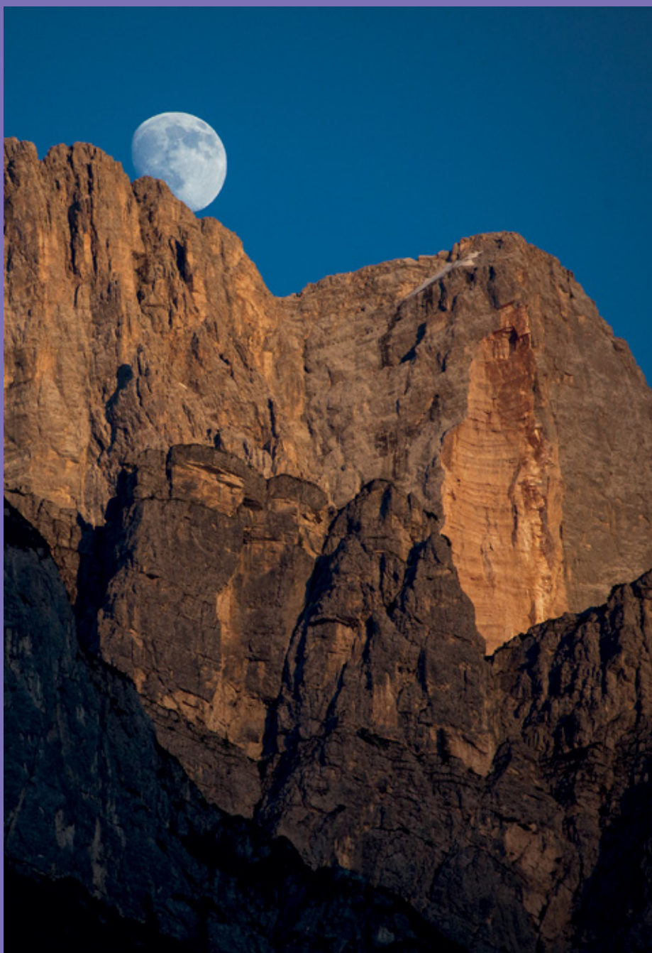
Manrico Dell'Agnola Parete Nord-Ovest della Cima su Alto (Civetta) dalla Valle Agordina – 2015