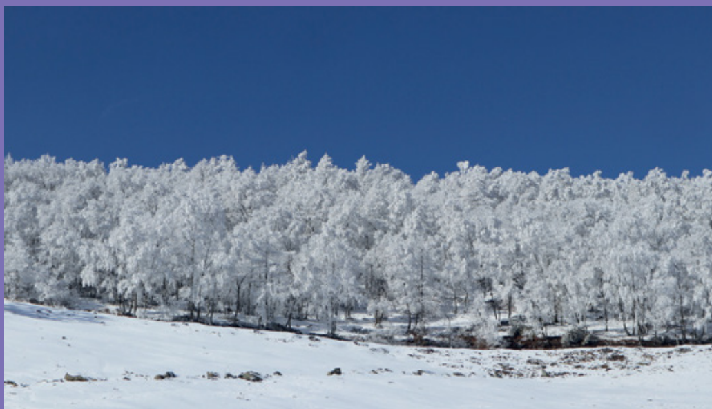
Roberto Bergamino Dopo la nevicata (Alpe Belvedere, 1450 m, Mezzenile – Valli di Lanzo)