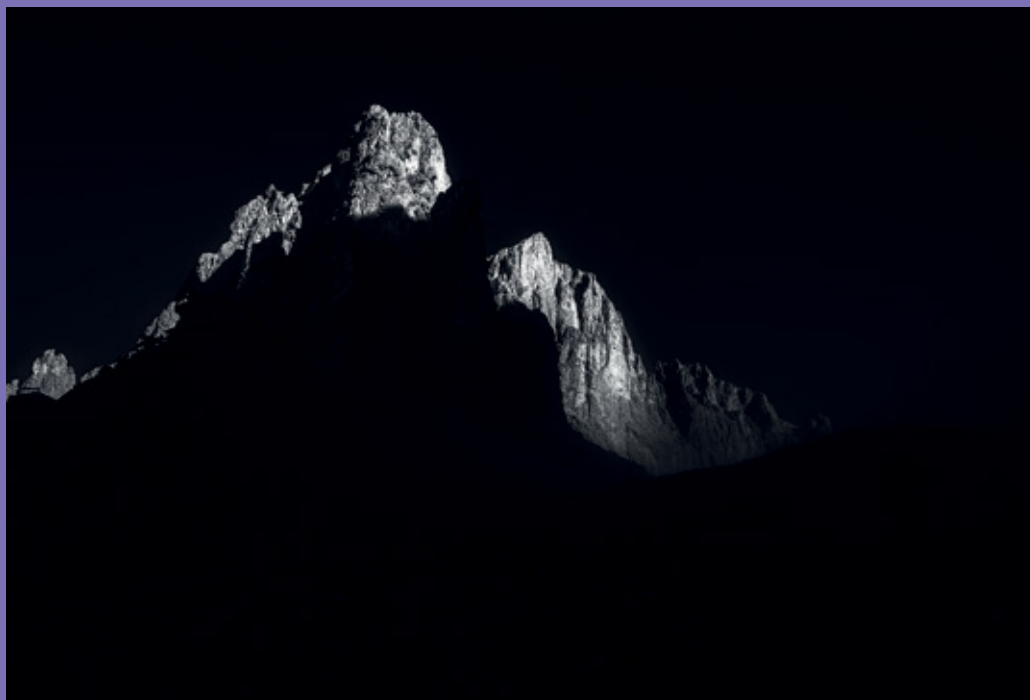
Alessandro Beltrame Alba sul Cimon de la Pala